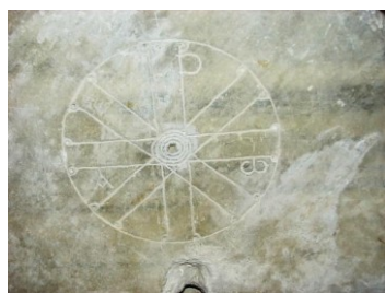
Chrisme du couvercle du sarcophage attribué à saint Césaire

Et pour contrebalancer les dangers de la dispersion, les articles sont regroupés selon un ordre rigoureux très universitaire qui constitue, en somme, la colonne vertébrale du livre.