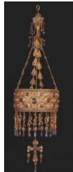
Couronne votive en or et pierreries

Aujourd'hui, les archéologues et les historiens proposent pourtant de nouvelles interprétations sur les transformations de l'Occident entre le III e et le VI e siècle. Si des pouvoirs barbares ont indiscutablement pris le contrôle des anciennes provinces de l'Empire, rien ne prouve qu'il s'agisse d'une invasion soudaine et violente.