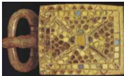
Boucle de ceinture à décor cloisonné

D'abord, le monde romain avait beaucoup changé avant même de subir ses premières défaites militaires. Ensuite, les nouveaux peuples ne viennent pas nécessairement de très loin.