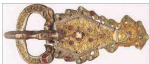
Plaque - Boucle de ceinture en argent doré