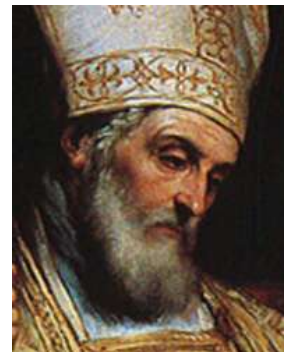
Isidore de Séville

Sous leur protection, une culture brillante vit le jour, marquée par une production législative abondante et par l'émergence de grands intellectuels dont Isidore de Séville est le plus célèbre représentant