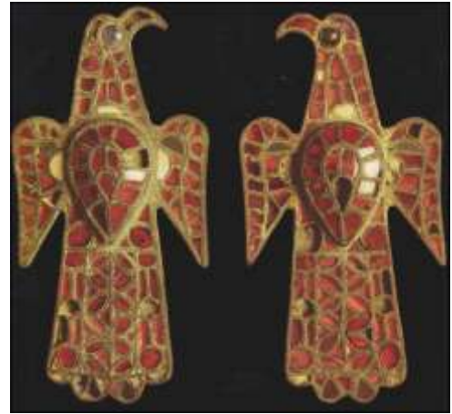
Fibule en forme d'aigle

Longtemps fidèles de l'hérésie arienne, leurs souverains passèrent au catholicisme en 589.