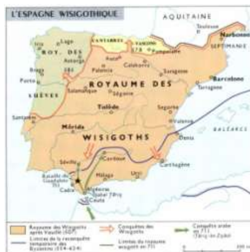
Tiré de l'Atlas historique Gorges Duby

Si l'on a souvent retenu leur pillage de Rome en 410, on pense moins à leur longue alliance avec l'Empire et à leur contribution décisive à la bataille des Champs Catalauniques, où Attila fut pour la première fois défait.