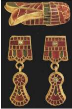
Fibule en or garnie et cloisonnée

De plus, à partir de 418, les Wisigoths constituèrent de puissants royaumes territoriaux, d'abord en Aquitaine, puis en Espagne.