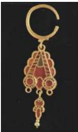
Anneau en or à pendentif cloisonné

Pour l'essentiel, la sombre réputation des « Goths » n'apparaît qu'à la Renaissance, dans un contexte de valorisation du passé romain aux dépens de tous les autres peuples du creuset européen.