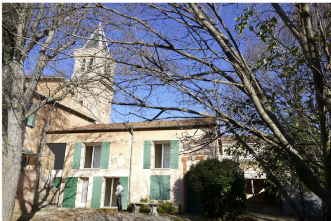
PROJET FAÇADE SUR COUR MODIFIÉE