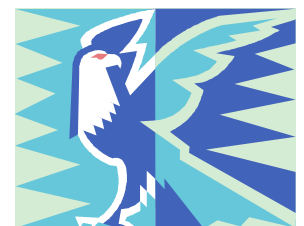
l'aigle de St Jean